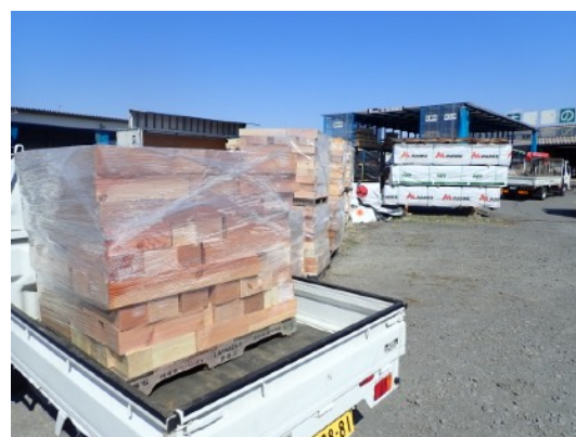
プレカット材の薪